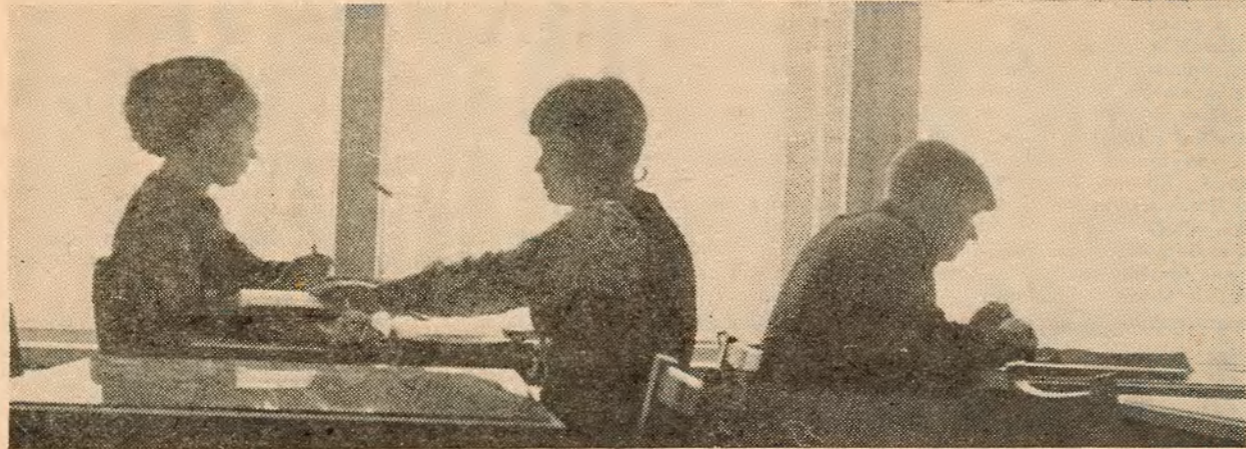
Другі семестр уступіў у свае правы. Зноў прыкавалі студэнцкую увагу бібліятэкі, чытальныя залы, кабінеты.

ДЗЕНЬ выдаўся на славу—сонечны, марозны. Мы ішлі па снежным пакрыццёвым возера міма застынуўшых над лункамі рыбакоў, аглядаючыся раз-пораз на адпльваючы з кожнай хвілінкі берэгі і лес, з якога выбегае наша лыжня. Уперадзе, за віднёчым на гарызонце краем леса, праходзіць шаша. Праз некаторы час мы да яе выйдзем. Наш паход закончыўся. Мы моцна звязем лыжы, здымем «пахудзеўшыя» за восем дзён рукавікі і сядзем у аўтобус, які на прамеральных дарогах пайміць нас у Мінск. Пад вечар мы зноў будзем любавіцца захадам сонца, але цяпер, з аўтобуса, ён будзе здавацца не такім, як учора, і нават самыя вялікія песні будучы здавацца не такімі вялікімі. У думках час ад часу мы будзем зноў пераносіцца назад, да тых цудоўна прайшоўшых вясмі дзён, успамінаючы кожны з іх асобна.